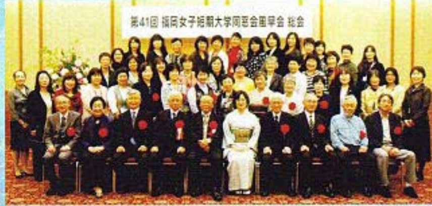
受付や会場準備のためにたくさんの方々にお手伝い頂きました。本当にありがとうございました。